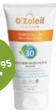
O'Zoleil Zonnecreme Body SPF 30 Waterproof Veilig en natuurlijk zonnen. 125ml voor 16.95