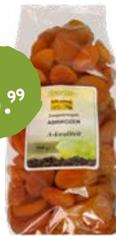
Boerjan Zongedroogde Abrikozen Vol vitamine A, vitamine E en vezels. Langer houdbaar door de zwavel behandeling. 1 kilo van 8.95 voor 5.99