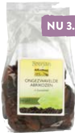
Boerjan Abrikozen Ongezwaveld 100% puur en naturel. Heerlijk zoet van nature, veel vitamine A, E en vezels. 500 gram van 4.99 voor 3.99 1 kilo van 8.95 voor 6.95