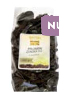
Boerjan Pruimen zonder pit Topklasse pruim zonder pit, heerlijk door de muesli. 500 gram van 4.99 voor 3.99 1 kilo van 8.95 voor 7.16