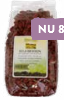
Boerjan Goji bessen Heerlijk in de salade of muesli. lekkere inheemse smaak! 500 gram van 10.95 voor 8.76