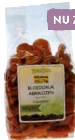
Boerjan Bloeddruk (zure) Abrikozen Rijk aan kalium. Zorgt voor een instandhouding van de normale bloeddruk. 500 gram van 9.99 voor 7.99