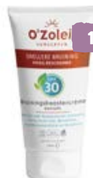
O'Zoleil Bruiningsboostercreme Sunbooster SPF 30 Face Vrij van microplastics. 50ml voor 14.95