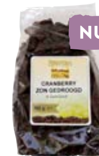
Boerjan Cranberries Suiker 59%, cranberries 40%, zonnebloemolie 1%. 500 gram van 5.95 voor 4.76 1 kilo van 11.49 voor 9.99