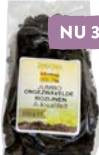
Boerjan Ongezwavelde rozijnen Rozijnen (gedroogde druiven) 99.5%, Mais olie 0.5%. 500 gram van 3.99 voor 3.19